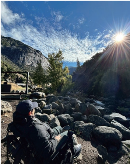
ヨセミテ国立公園の綺麗な岩肌と太陽

スコのジャズバーでは生演奏を聴けるとのことだったが、演奏するステージは地下でエレベーターはなかった。地下から聴こえてくるジャズに悔しさとリアルを感じながら、1階部分のバーで飲んだ。アメリカに来てから車椅子でも何でもできる！と感じていたため、大きなギャップを感じた。同時に法律や制度はできて終わりではなく、時代とともにアップグレードしていく必要がある。