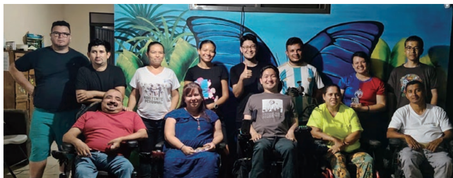
モルフォセンターにてスタッフと集合写真

しかしADAも完璧ではなかった。「構造上改修が難しい場合は適用外」というルールがADAにはあるのだ。おそらくこれに該当するためにバリアフリー整備が不十分な建物が2つあった。サンフランシ