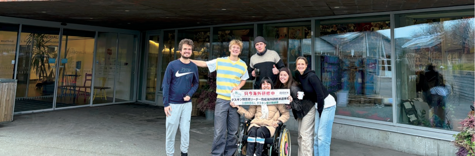
現地のエグモント生と

は私ができないことを何でも手伝ってくれる存在だと思い込んでいた。初日のオリエンテーションのときに障がいをもつ生徒が集められ、先生に真剣な顔で「自立しよう!」と言われたことが今でも鮮明に覚えている。自立と聞くと、人に頼らずに一人で生活をするイメージがあったため人に手伝いを求めることを禁止されているような気持ちになり、当時の私にはとても厳しく感じた。その日からヘルパーをどう活用していくか勉強の日々が始まった。最初の頃は自分は何ができないのか、どういった介助が必要なのかも分からなかった。主なヘルプ内容としては、食事がビュッフェ形式のため朝昼晩のお皿の配膳と部屋の掃除をお願いした。最初は順調だったのだが、中盤になり、私のヘルプについて話し合いをした際、ヘルパーに「何をどうやって手伝ったらいいのか分からない」と辛辣な意見を