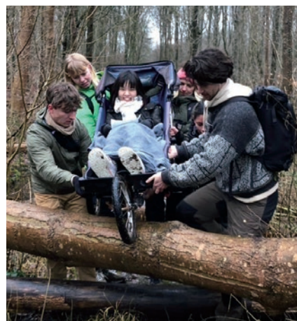
アウトドアの授業にて

次にインクルーシブについて学んだことについて書きたい。エグモントではfællesskab(フェレスケープ)「一体感」を大事にしてい