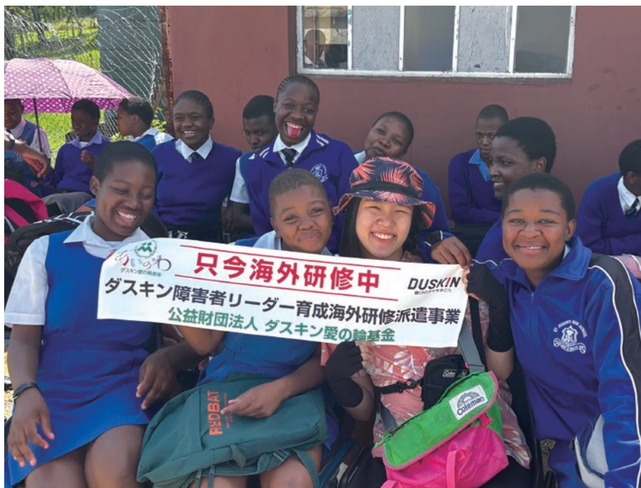
研修旅行先の南アフリカのBesøge handicap skoleの生徒と

私は今まで日本でヘルパーを雇った経験がなく、他人に助けをもらいながら生活を送るのはエグモントが初めてだった。ヘルパー