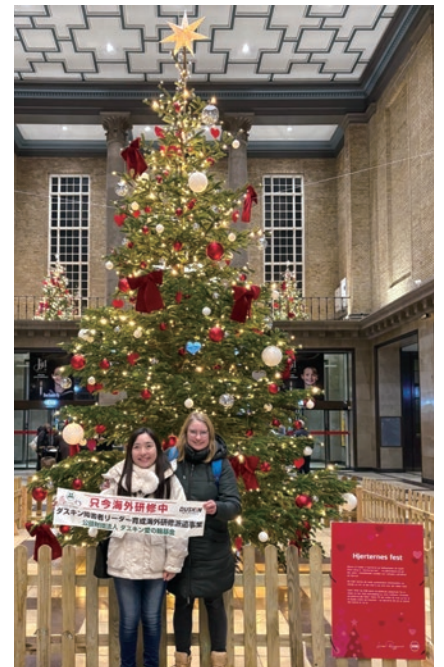
デンマークでできた友だちと オーフス中央駅のクリスマスツリーの前で

できることは自分でやってできない部分だけを手伝ってもらうようにすること、シフトを考える際やその時々状況に応じて一人ひとりのことを可能な範囲で考えたり意見を汲み取ったりしながら互いに無理のないように心がけること、私自身も友達として仲間としての関係を意識して関わるようにしました。特に、自分にとって必要なサポートは何かを明確にし、それを伝え、その必要な部分を手伝ってもらうようにすること、も