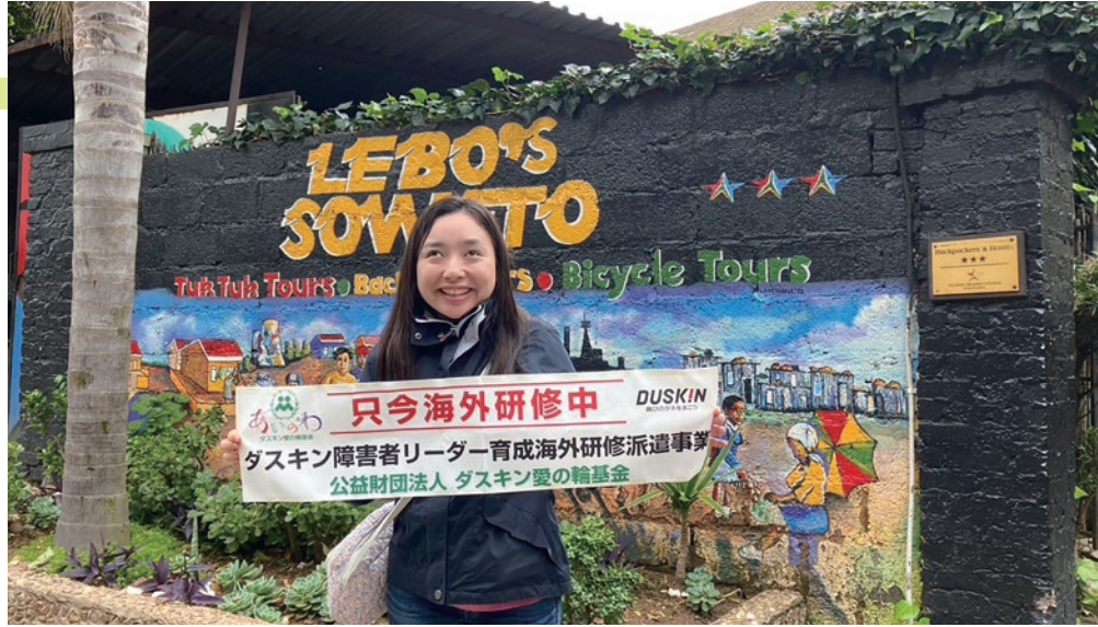
南アフリカのスイートーで

以上のように、この1年間を通して、特に印象に残ったことを中心に記述させていただきました。私の研修テーマは「視覚障害のある人が社会参加するために必要な支援体制のあり方を学ぶ」でした。当初はアメリカの視覚障害関係の専門機関での研修を計画していたため、本来のテーマに沿った学びがどれほど