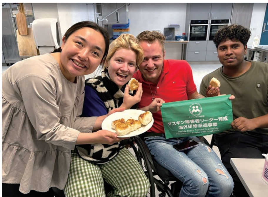
日本食クラブを開催

数派の立場となる傾向にあると思います。一方でデンマークは、高校を卒業したらギャップイヤーを取る人、進学する人、働く人など、より多くの選択肢があるように感じました。特にギャップイヤーは日本にはあまりない考え方で、きちんと休むことが大切にされていること、たとえ学校や職場に所属していなかったとしてもネガティブな印象だけが持たれないこと、旅行して見聞を広げることが大事な時間として捉えられていること、このように新たな考え方や価値観に触れることができました。私はギャップイヤーという文化に触れたことで、人生において休む時間は重要だと改めて気づきました。この1年間は私にとって、日常から離れ、多くの経験をして新たな文化や価値にたくさん触れることができ、自分自身がリフレッシュしながら成長することのできた、ある意味ギャップイヤーのような人生において大切な時間だったように感じています。だからこそ帰国した今、また次に向かってエネル