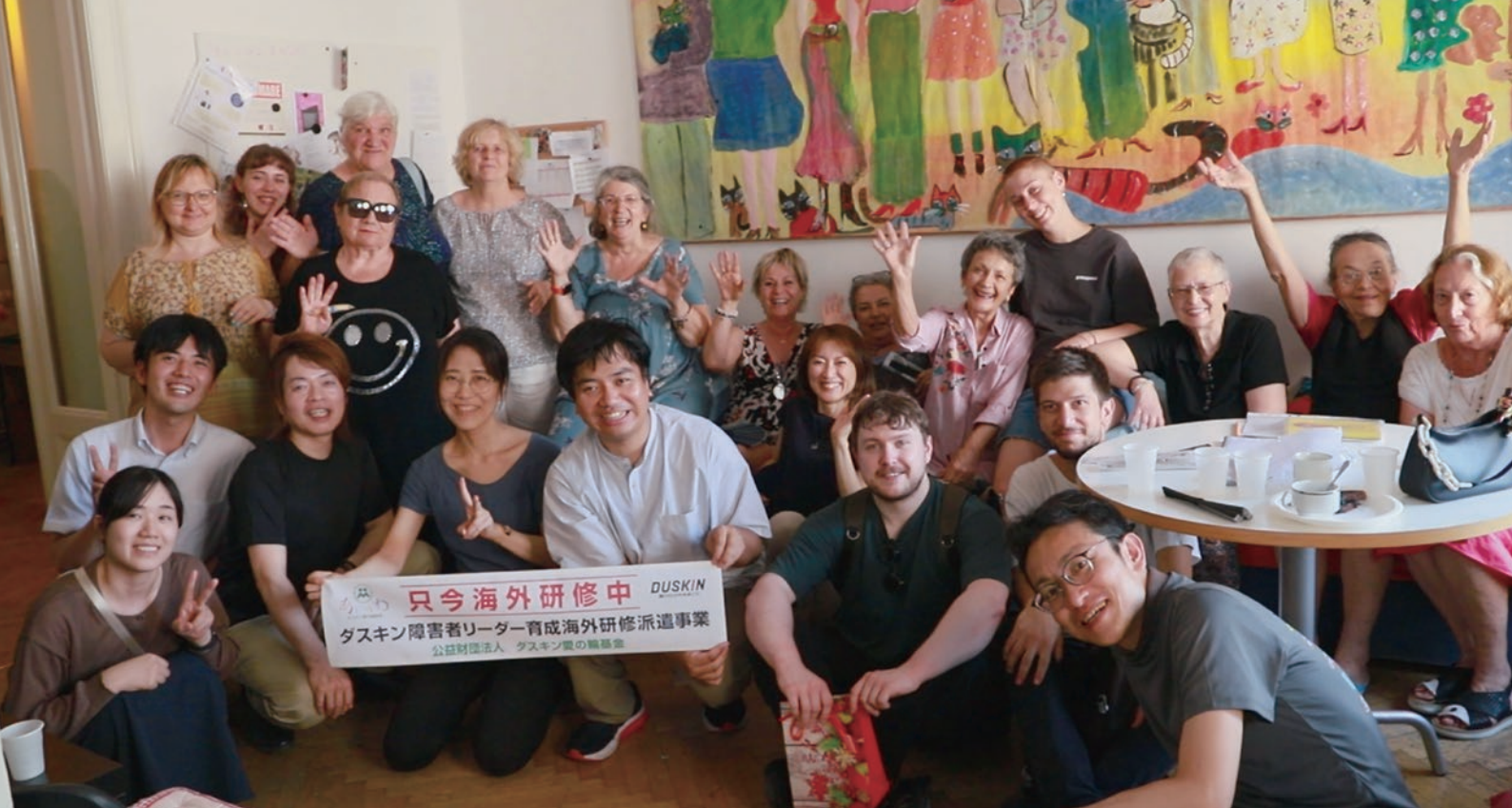
当事者をサポートする女性支援施設にて(トリエステ)

と、地域ごとの避難によって孤立が防止されること、平時から地域住民が防災に関わる機会が多いことなどです。団体では、防災に関する調査活動や啓発活動を行ってきました。今後の実践に大いに参考にしたいと思います。