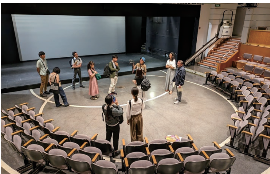
Teatro Arena del Sole

バザーリア法成立の舞台となったトリエステが、3カ所目の訪問都市となりました。バロック調の街並みはオーストリアの影響が色濃く表れる港町です。滞在期間中はストライキの影響で、訪問先の変