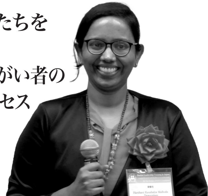
スリランカ(マールラベ)出身 29歳(2024年11月現在) 視覚:弱視